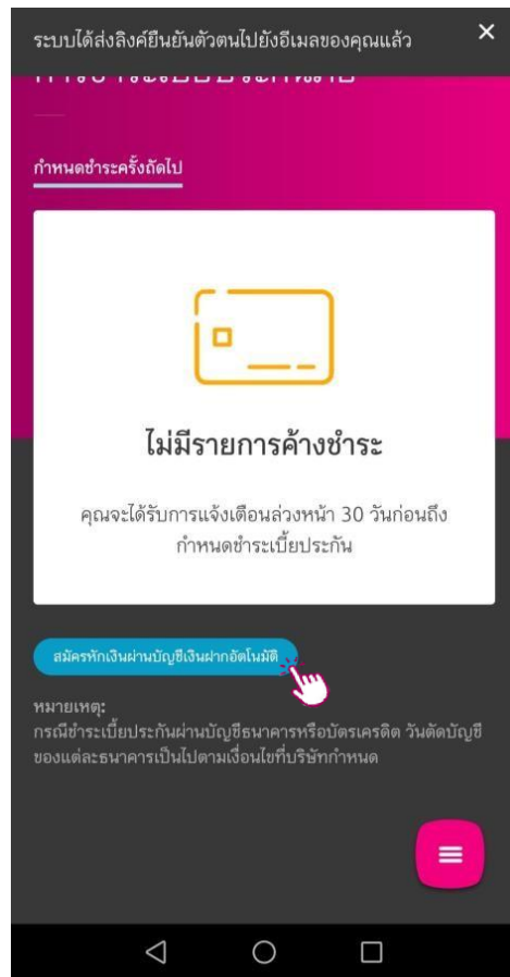
เลือกสมัครหักเงินผ่านบัญชีอัตโนมัติ