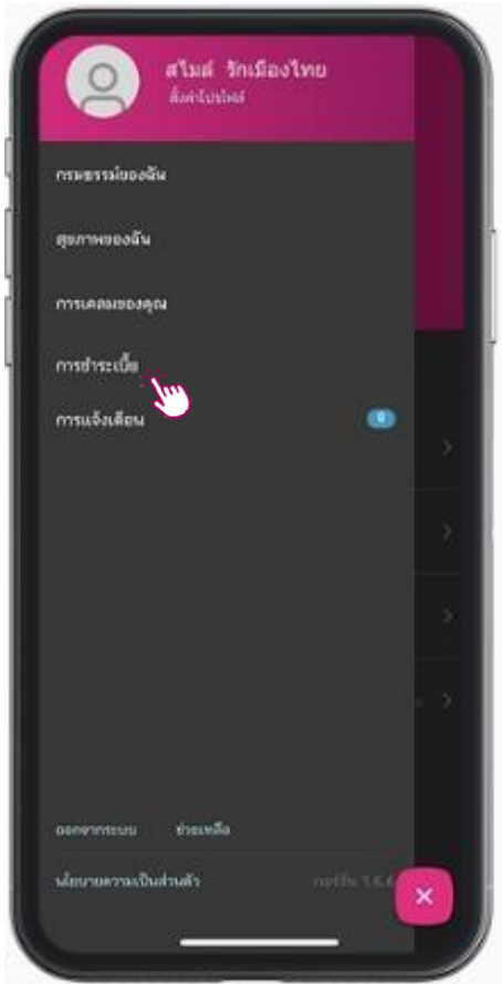
เข้าเมนูการชำระหนี้